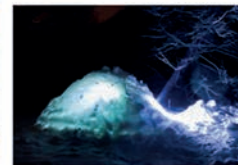
Nuit sous igloo en Haute-Ubaye Barcelonnette