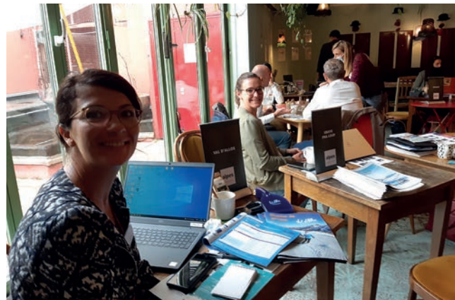
Paris le 14 octobre