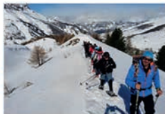
Journée raquettes en Haute- Ubaye Barcelonnette