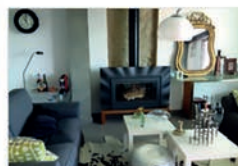
Séjour au coin du feu en Gîtes de France Digne-les-Bains