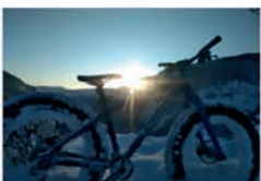
Fat Bike dans le Haut-Verdon Thorame-Haute