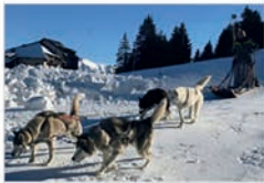
Baptême en chiens de traîneaux à Chabanon Selonnet