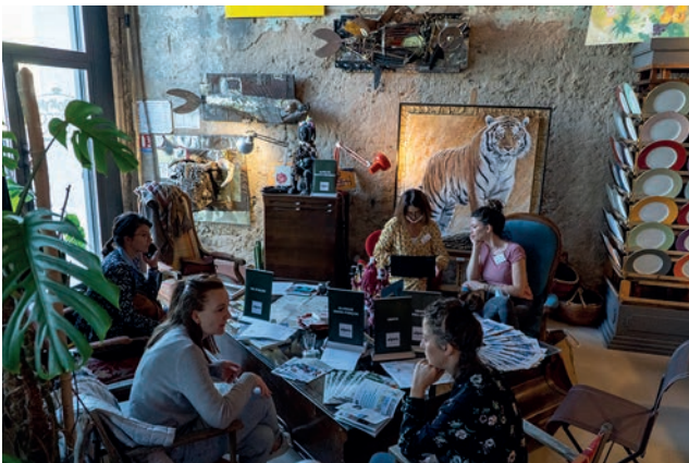
Marseille le 18 octobre

Les destinations avaient à cœur de sensibiliser les journalistes sur un enjeu majeur : il faut à tout prix réussir cette saison d'hiver. Pour ce faire, elles ont rivalisé d'imagination pour se dévoiler sous leurs meilleurs atouts : expériences et idées de séjours neige, valeurs écoresponsables et nouveaux équipements en stations, hébergements de charme ou insolites, bons plans, ski pass et autres forfaits... Stations grands domaines, stations-villages, domaines nordiques, grands espaces préservés...une montagne d'idées !