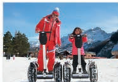
Découvrez le Gyropode en Ubaye Barcelonnette

Venez cet hiver dans les Alpes de Haute Provence !