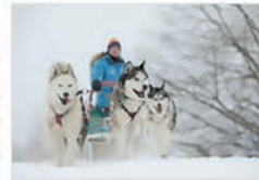
Chiens de traîneau, repas et nuit à la yourte Barcelonnette