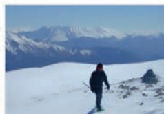
Séjour "Raquette à neige et "Sophrologie" Auzet