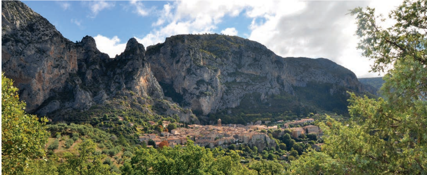
Moustiers Sainte-Marie

aux portes du Grand Canyon du Verdon, l'un des plus beaux villages de France